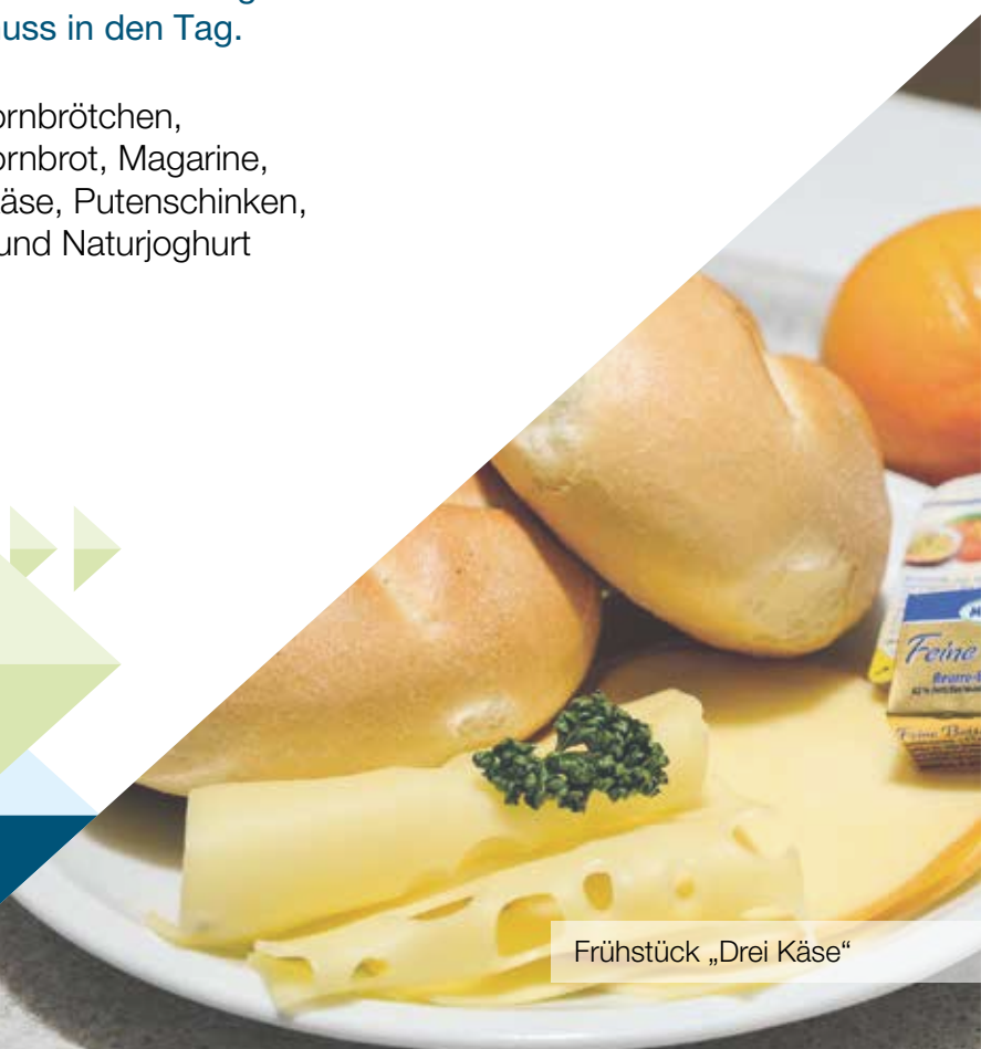
Frühstück „Drei Käse“