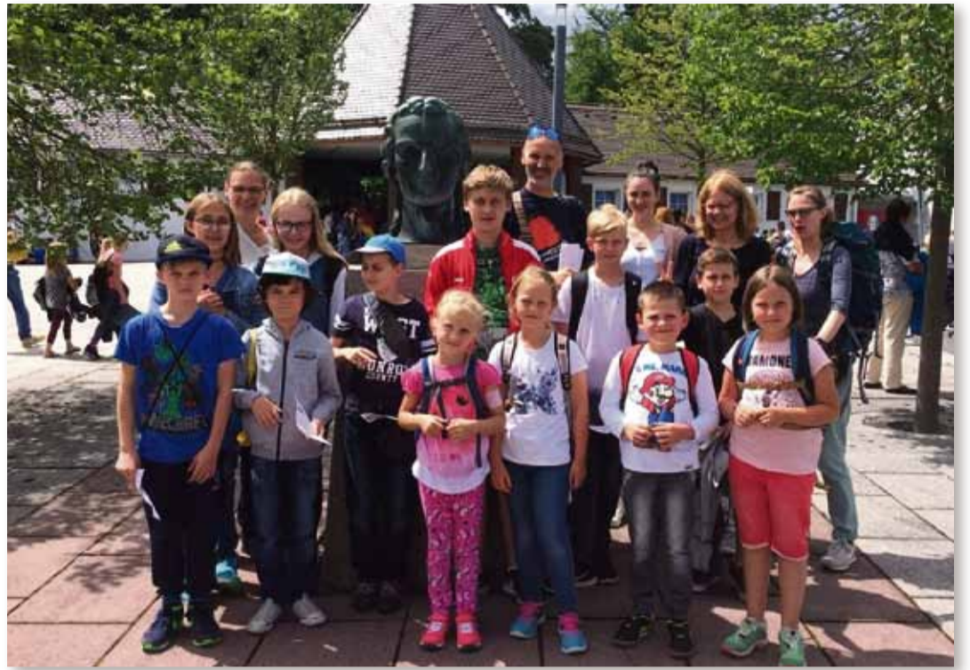
Treffpunkt war die Schillerbüste vor dem Naturtheater. Von dort aus starteten die Kinder mit ihren Betreuern zu den Zuschauerrängen, von wo aus die Gruppe verfolgen konnten, wie die Vogelscheuche den Verstand, der Blechmann ein Herz und der Löwe seinen Mut fanden.