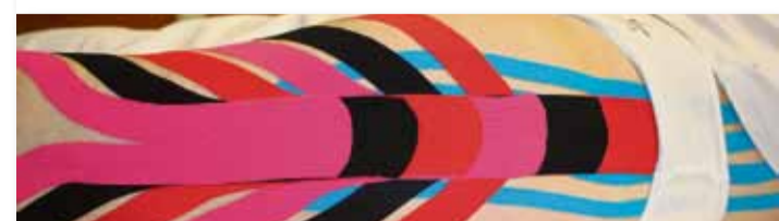
Lymphtape bei sekundärem Beinlymphödem