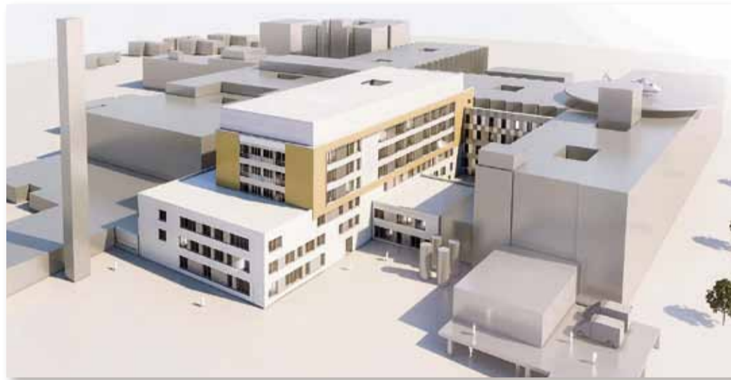
Modell des Hauses B 1, das zwischen den bestehenden Gebäuden Funktionsbau (links) und Haus C (rechts) in den kommenden rund drei Jahren in die Höhe wachsen wird. Grafik: ARGE

Im Rahmen des anstehenden 2. Bauabschnitts, der mit dem Abriss des Erweiterungsbaus durch die Firma Max Wild GmbH, Berkheim, startet, werden für den Zentralen OP-Bereich, Radiologie, Apotheke, Zentrale Sterilgutversorgungsabteilung sowie drei Pflegestationen neue Räume mit sehr moderner Ausstattung für die Patientenversorgung entstehen. Der Neubau wird insgesamt 65.800 cbm umbauten Raum umfassen. Für ärztlich-pflegerische Bereiche werden auf sechs Ebenen 6.650 qm Nutzfläche zur Verfügung stehen (ohne Technik- und Verkehrsflächen). Die Maße des Neubaus, bei dem sieben Geschosse zu sehen sein werden, betragen 72 m Länge, 31 m Breite, 22,5 m Höhe über Gelände und 8,5 m unter Gelände. Außerdem wird eine rund 110 m lan-