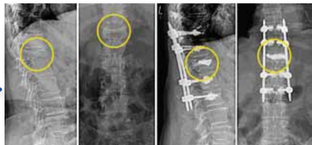
Hybridversorgung einer instabilen „BWK-12-Fraktur“ (Bruch des 12. Brustwirbelkörpers). Der geborstene Wirbel wurde mit einer Kyphoplastie aufgerichtet und langstreckig von BWK 10 (10. Brustwirbelkörper) bis LWK 2 (2. Lendenwirbelkörper) überbrückt. Da der Fixateur vier unverletzte Bandscheiben fixiert, sollte er bei ausgeheilter Fraktur nach ca. sechs bis zwölf Monaten bei aktiven Patienten entfernt werden.