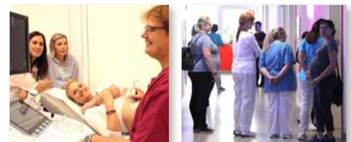
Zwischen 11 und 15 Uhr ließen rund 30 Schwangere eine 3-D- oder 4-D-Ultraschalluntersuchung durchführen.

Am Freitag, 1. September 2017, veranstaltete das Team der Klinik für Frauenheilkunde und Geburtshilfe einen Tag der offenen Tür in der neuen Gynäkologie-Ambulanz des Klinikums. Nach drei Jahren Ambulanzbetrieb im Erdgeschoss des Hauses ging diese neue Einrichtung im 3. Obergeschoss im August 2017 in Betrieb.