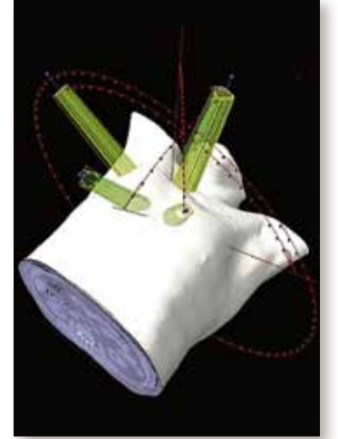
Darstellung der Bestrahlungsfelder (Startwinkel sind grün markiert) im dreidimensionalen Patientenmodell. Ein Bestrahlungsfeld ist jeweils durch einen rot markierten Bogen (Start und Ende der Rotation der Gantry) um den Patienten gekennzeichnet.

Bestrahlungsplan wird für die Strahlentherapie ausgewählt.