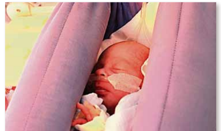
Sicher und wohlig warm eingebettet in einer „Mini-Hängematte“ erhalten die Frühchen viel Aufmerksamkeit und Zuwendung für die Zeit des Reifens, die sie noch benötigen.

Es ist ihr Ziel, Mutter und Kind so schnell wie möglich wieder zusammenzubringen.