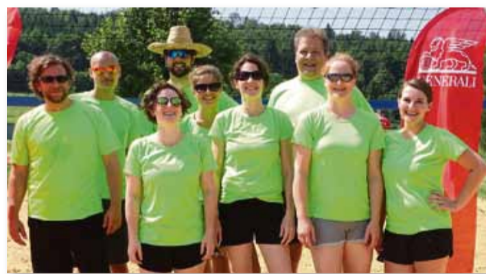
Die Volleyballteammitglieder aus dem Klinikum.

Die diesjährige Teilnahme am Benefiz-Beachvolleyballturnier der Generali am Samstag, 8. Juli 2017 war die erfolgreichste für das Team der Klinik. Insgesamt nahmen 16 Mannschaften auf dem Sportgelände beim Heidenheimer Werkgymnasium teil.