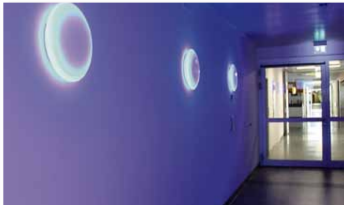
Spezielle Lichteffekte erleben die Patientinnen.