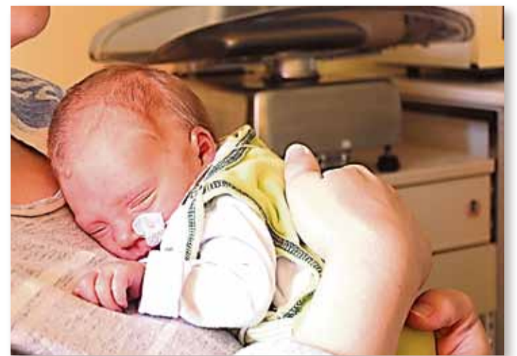
Auch eine Form des „Känguruhrns“ – zärtliches Kuscheln auf Mamas Oberkörper – ein jedes Frühchen entspannt dabei, atmet ruhiger und dies alles in einer angenehmen Atmosphäre ohne Hektik für Mutter und Kind.

Auch wenn die Schwangerschaft problemlos bis in die Nähe des errechneten Geburtstermins verlaufen ist, gibt es reife Neugeborene, die beispielsweise eine Neugeboreneninfektion aufweisen oder sich mit der Anpassung an das Leben außerhalb des Mutterleibes schwer tun. Immerhin ist der Wechsel aus dem kuscheligen, temperierten Nest, wo man praktisch all-inclusive versorgt wurde, in die vergleichsweise helle, kalte Welt, wo man alles selber machen muss, eine beachtliche Leistung. Ganz plötzlich soll das Baby selber atmen, die Temperatur halten, trinken und verdauen und sich mit so viel Platz zurecht finden. Die meisten dieser Kinder brauchen die Unterstützung durch das klinische Personal für zwei bis drei Tage, dann können sie zurück zu Mama. Natürlich hoffen alle Eltern auf eine traumhafte Schwangerschaft, eine kurze, schmerzlose Geburt und darauf, nach zwei Tagen mit ihrem Kind nach Hause gehen zu dürfen. Das wünschen die Beschäftigten der „Kinderklinik“ auch allen Eltern - auch wenn die Realität in manchen Punkten abweicht. Nichtsdestotrotz sind sie da, wenn nicht alles nach Plan verläuft und ihre Unterstützung gebraucht wird.