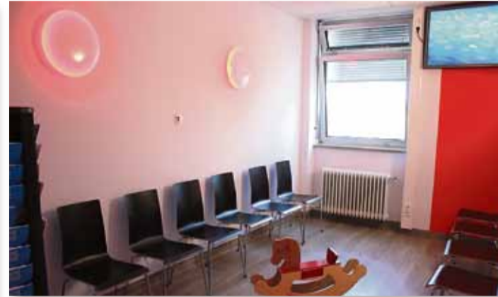
Das stilvolle Ambiente des neuen Wartebereichs mit großem Infobildschirm.

Anmeldungen mit Terminvereinbarungen für die Sprechstunden in der Ambulanz können unter folgenden neuen Telefonnummern bzw. Telefaxnummern erfolgen: