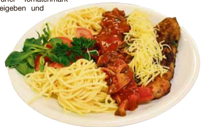
Kalbschnitzel pikant mit Tomaten-Champignonsoße

Zubereitung Die Kalbschnitzel trocken tupfen und flach klopfen und anschließend mit Pfeffer, Paprika Thymian, Rosmarin, Basilikum würzen und im Mehl wenden. Danach die Schnitzel in Olivenöl erhitzen und von beiden Seiten fünf Minuten anbraten. Die Tomatensoße mit einer Mehlschwitze vorsichtig anrichten und die Zutaten Tomatenwürfel Tomatenmark beigegeben und