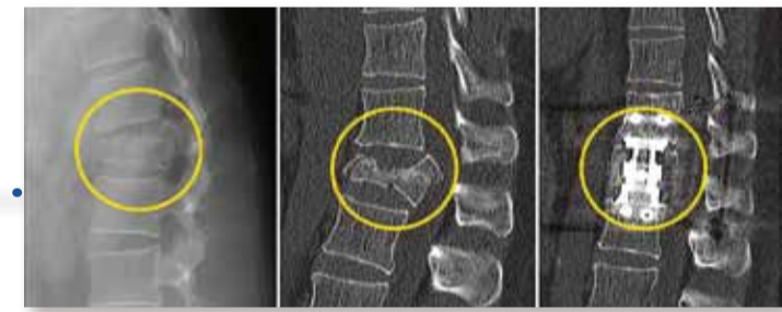
Darstellung eines instabilen kompletten Berstungsbruchs des ersten Lendenwirbelkörpers mit Verlegung des Spinalkanals durch Hinterkantenfragmente um ca. 70 %. Es erfolgte eine Stabilisierung durch ein Schrauben-Stab-System von hinten und ein Wirbelkörperersatz in thorakoskopischer Technik von vorn.