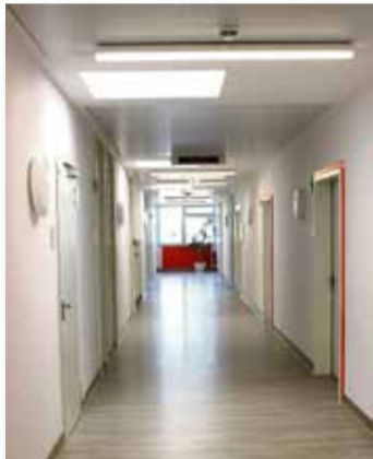
Lichtdurchflutet – der Flur der neuen Ambulanz

Gewinnung einer Gewebeprobe (Histologie) mit einer Stanzbiopsie in örtlicher Betäubung durchgeführt. Bis Jahresende soll das Spektrum um eine Dysplasie-Sprechstunde für spezielle Erkrankungen des Gebärmutterhalses erweitert werden.