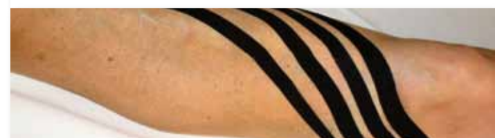
Ein aktiv-dynamisches Tape am Unterschenkel