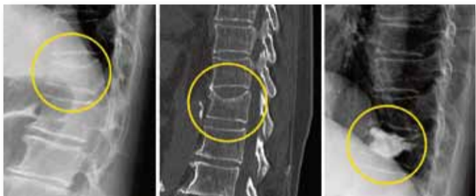
Darstellung einer osteoporotischen BWK-12-Kompressionsfraktur. Therapieresistente Schmerzen unter konservativer Therapie. Nach Kyphoplastie konnte die Patientin selbstständig gehen. Das rechte Bild zeigt eine Verlaufskontrolle nach 12 Wochen mit guter Stellung der Wirbelsäule.